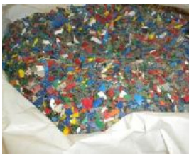
Material listo para enviar a la empresa recicladora.

Harrিতa eta eskertuta gaude erantzunagatik. Ez genuen espero kanpaina hainbeste luzatuko zenik eta horrelako jendetza murgiltzea. Bene-benetan eskertu nahi dizuegu zuen elkartasuna eta zuen lana: MILA ESKER